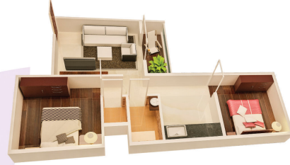
२ बीएचके फ्लॅट